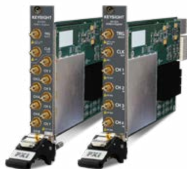
PXIe 数字化仪, 100 MSa/s, 14 位, 100 MHz

是德科技公开了其 PXI 和 AXI 仪器规范，允许用户将自定义的用户数据或进程插入仪器的 FPGA。无论工程师是否熟悉 FPGA 技术，都能通过 PathWave FPGA 为众多是德科技仪器添加逻辑、控制和组合例程。PathWave FPGA 内置的程序库包含丰富的程序代码，您可以将这些代码插入到设计原理图中。