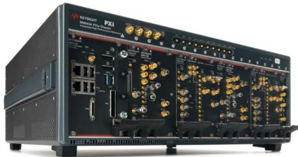
M9383B 微波信号发生器, 1 MHz 至 44 GHz

PathWave 信号生成软件是一套灵活的信号生成工具，可缩短信号仿真时间。它提供经过是德科技验证和性能优化的参考信号，可增强对器件的表征和验证能力。