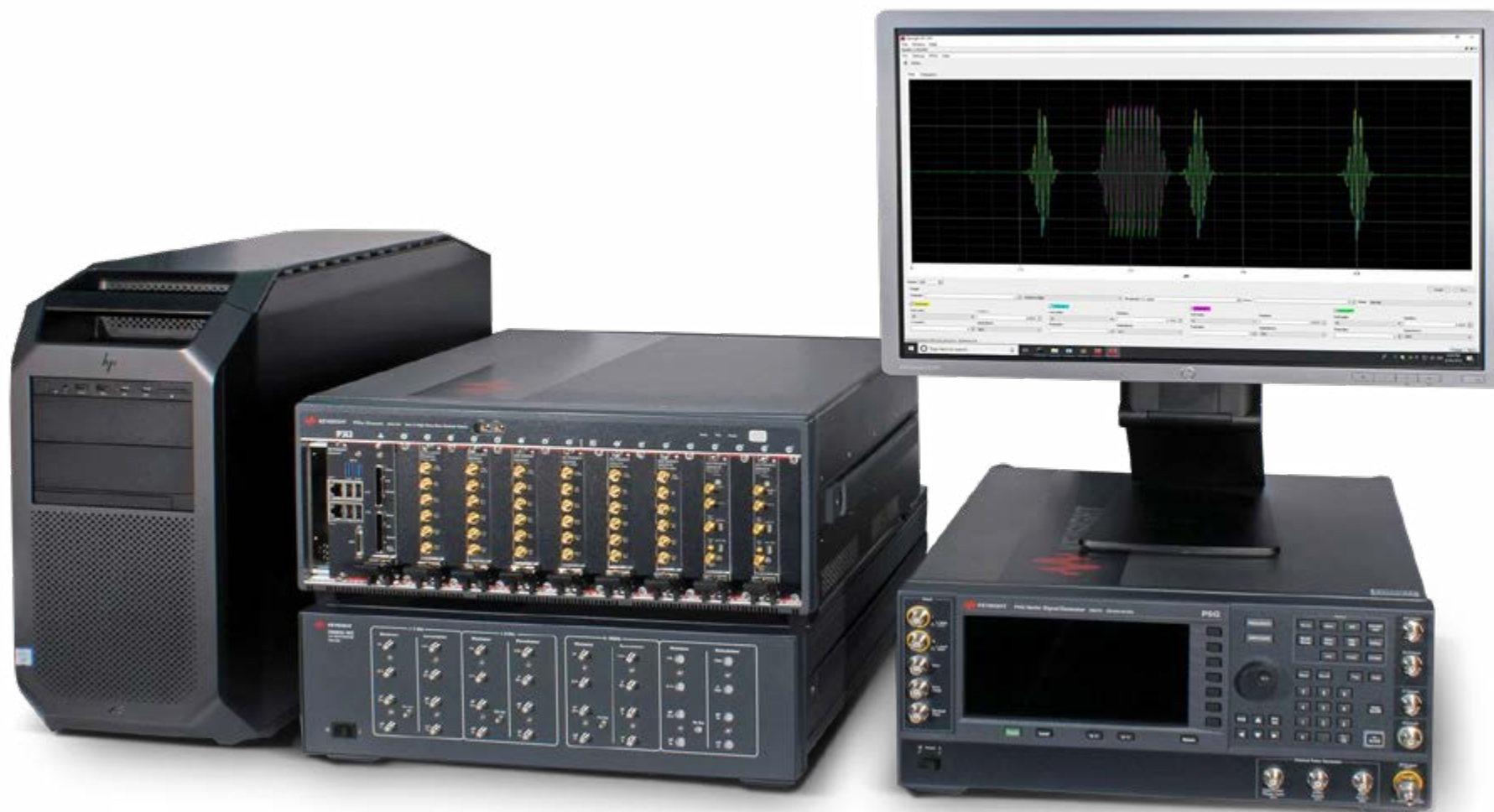
S5060A 量子工程工具套件

量子工程工具套件是一个功能强大的系统，单量子比特或多量子比特研究实验室可以用它来开展试验。该套件的目标是依托是德科技强大的电子专业技术打造综合解决方案，供全球各地的量子实验室轻松使用。