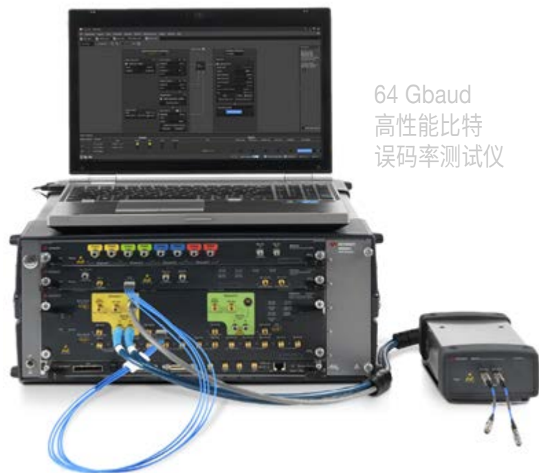
64 Gbaud 高性能比特 误码率测试仪

利用更多功能特性为您量身打造比特误码率测试仪。我们提供丰富的软件、附件和服务产品供您选择, 确保您充分发挥仪器的最大功效。您可以在购买仪器时选配这些产品, 也可以在以后随时升级购买。