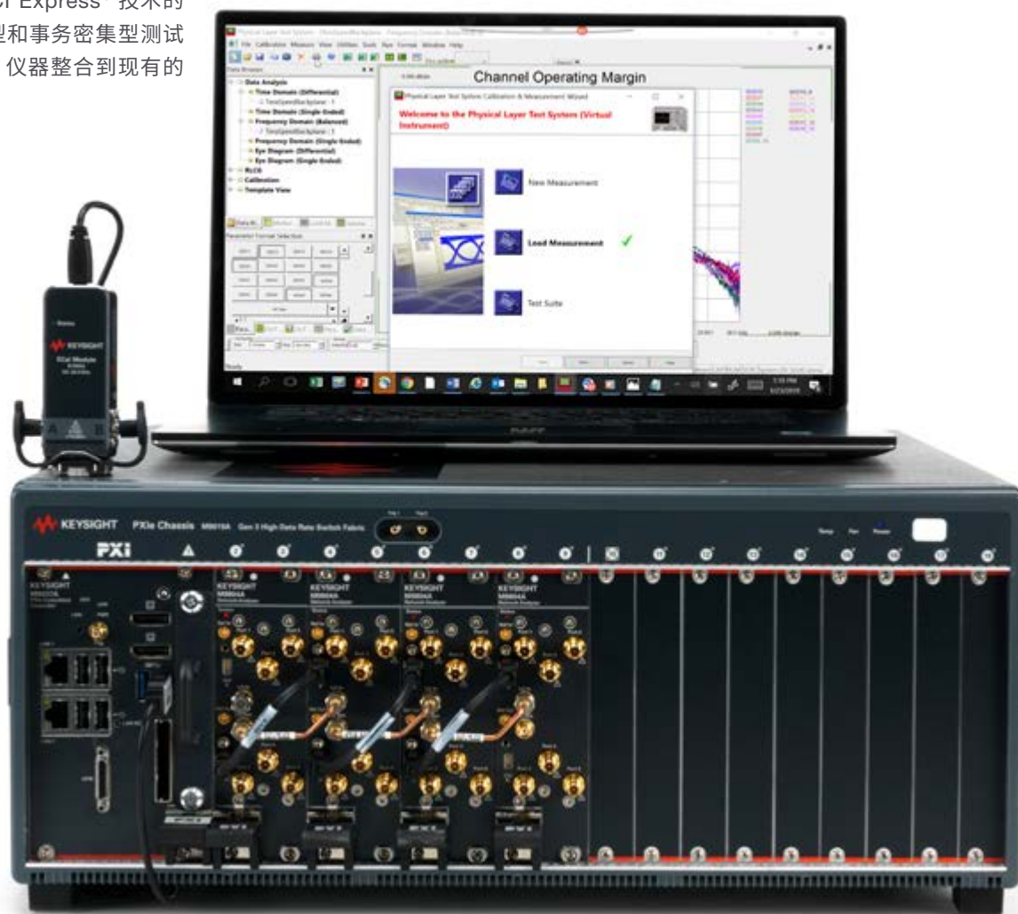
M9804A 和 N1930B 物理层测试系统 (PLTS) 2020 版软件

PXI 是一个由 PXI 系统联盟负责管理的开放式多厂商标准,旨在确保不同厂商所生产的模块和机箱具有良好的互操作性。PXIe 背板总线充分利用 PCI Express® 技术的优势,可以极大提高测试速度并降低时延,特别适合数据密集型和事务密集型测试应用。该总线还支持系统随着测试需求的变化进行扩展。将 PXI 仪器整合到现有的台式、PXIe 或 AXIe 仪器测试系统中。