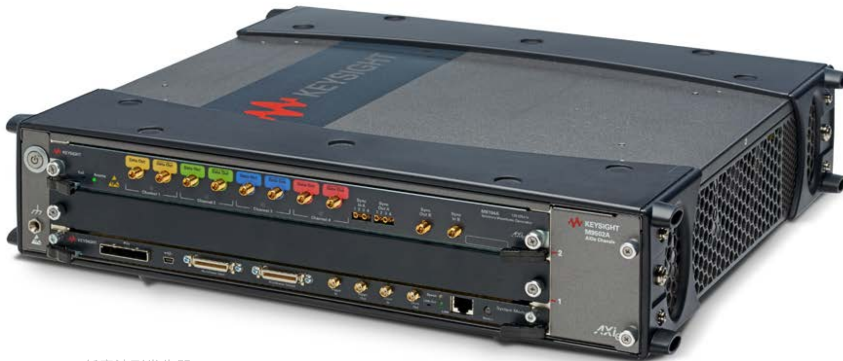
M8194A 120 GSa/s 任意波形发生器

AXIe 是基于先进电信计算体系结构 (AdvancedTCA) 的新一代开放标准。它增加了每个插槽的可用功率和裕量，从而有助于开发切换速度更快、功率更大、测量体系结构更复杂的高性能模块。AXIe 仪器可为航天航空与国防、高能物理、半导体测试等行业的高性能测试和测量系统提供时序、触发和模块间数据移动功能。机箱和模块组成台式和 PXI 产品，而且还配有 PCIe 和 LAN 接口，使它们能够像虚拟 PXI 或台式仪器一样工作。