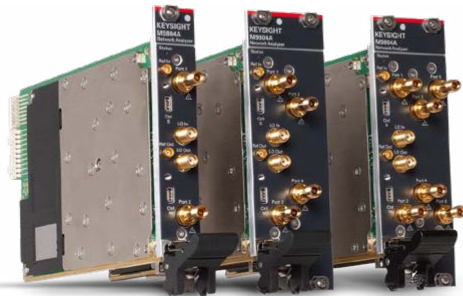
M9804A PXI 矢量网络分析仪