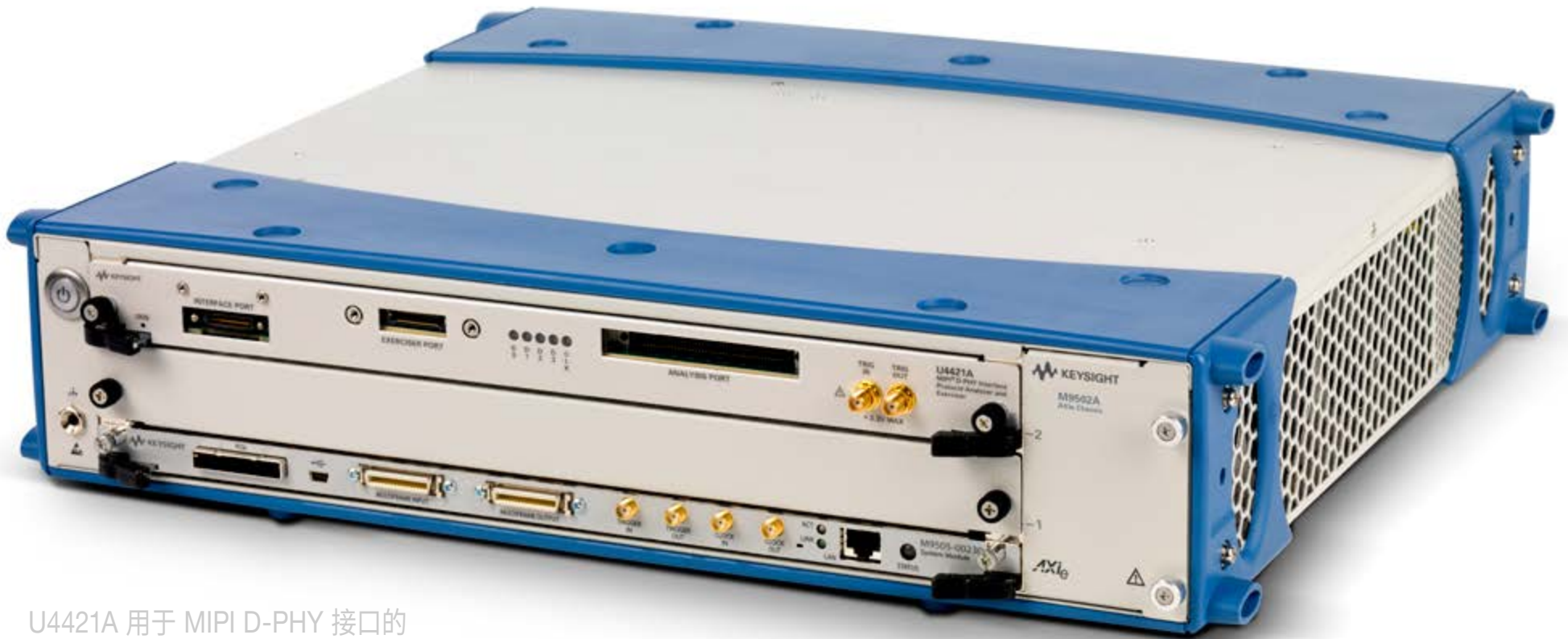
U4421A 用于 MIPI D-PHY 接口的 协议分析仪和训练器

Keysight AXIe 模块化逻辑分析和协议测试模块以及功能强大的分析软件为工程师提供了许多不可或缺的功能，协助他们开发采用高速并行和串行总线（如 DDR 和 PCI Express Gen 3）的高速数字设计和芯片设计。