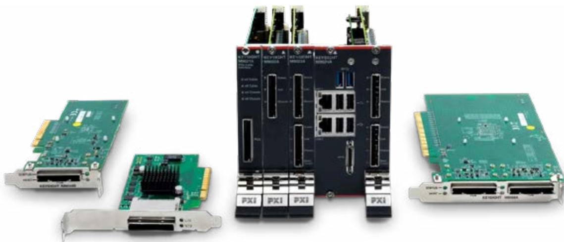
接口模块和适配器 PXIe 和 AXIe 系统

Keysight PCIe 和 PXIe 接口模块实现从远程或嵌入式计算机到一个或多个机箱的高性能可靠连接。是德科技的 Gen 2 和 Gen 3 高性能接口模块可实现从远程或嵌入式计算机到 PXIe 或 AXIe 测试系统或是到多个 PXIe 或 AXIe 机箱的连接。