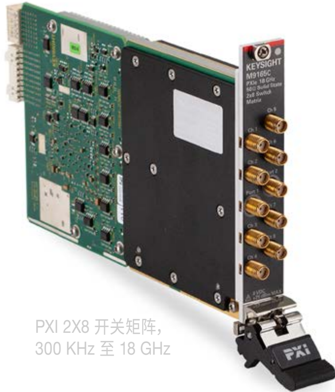
PXI 2X8 开关矩阵， 300 KHz 至 18 GHz