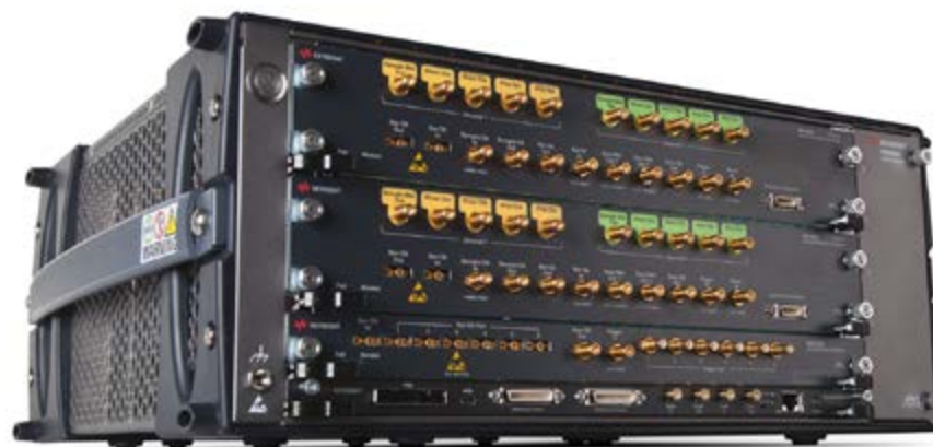
M8190A 12 GSa/s 任意波形发生器

Keysight M8100A 系列任意波形发生器提供的激励源可以满足大量应用的要求。这些任意波形发生器具有出色的精度、速度和灵活性，可以帮助您应对非常棘手的挑战。