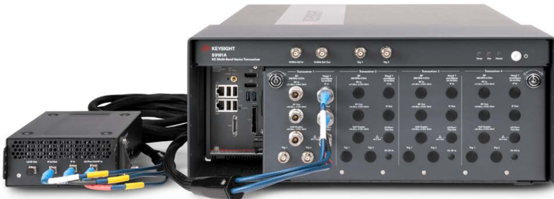
S9101A 5G 多频段矢量收发信机

S9101A 5G 多频段矢量收发信机测试解决方案是一个精简的非信令测量系统，可以自动测试频率范围 1 (6 GHz 以下) 和频率范围 2 (24-44 GHz) 频段内的 5G NR 基础设施设备。这个紧凑型解决方案使用户能够在大规模 4G 和 5G 毫米波测试中验证 5G 射频无线性能。其精度能够满足在所有新的 5G NR 频段中进行带内设计验证的要求。再加上模块化的体系结构、易于使用的 API 以及 Keysight PathWave 解决方案软件，S9101A 可以降低测试成本，加快量产进度，尤其是在毫米波应用中。