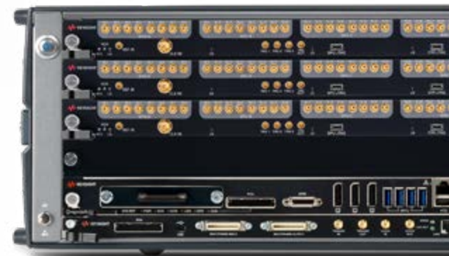
AXIe 高速数字化仪/ DAQ, 8 位, 1 GS/s, 32 通道