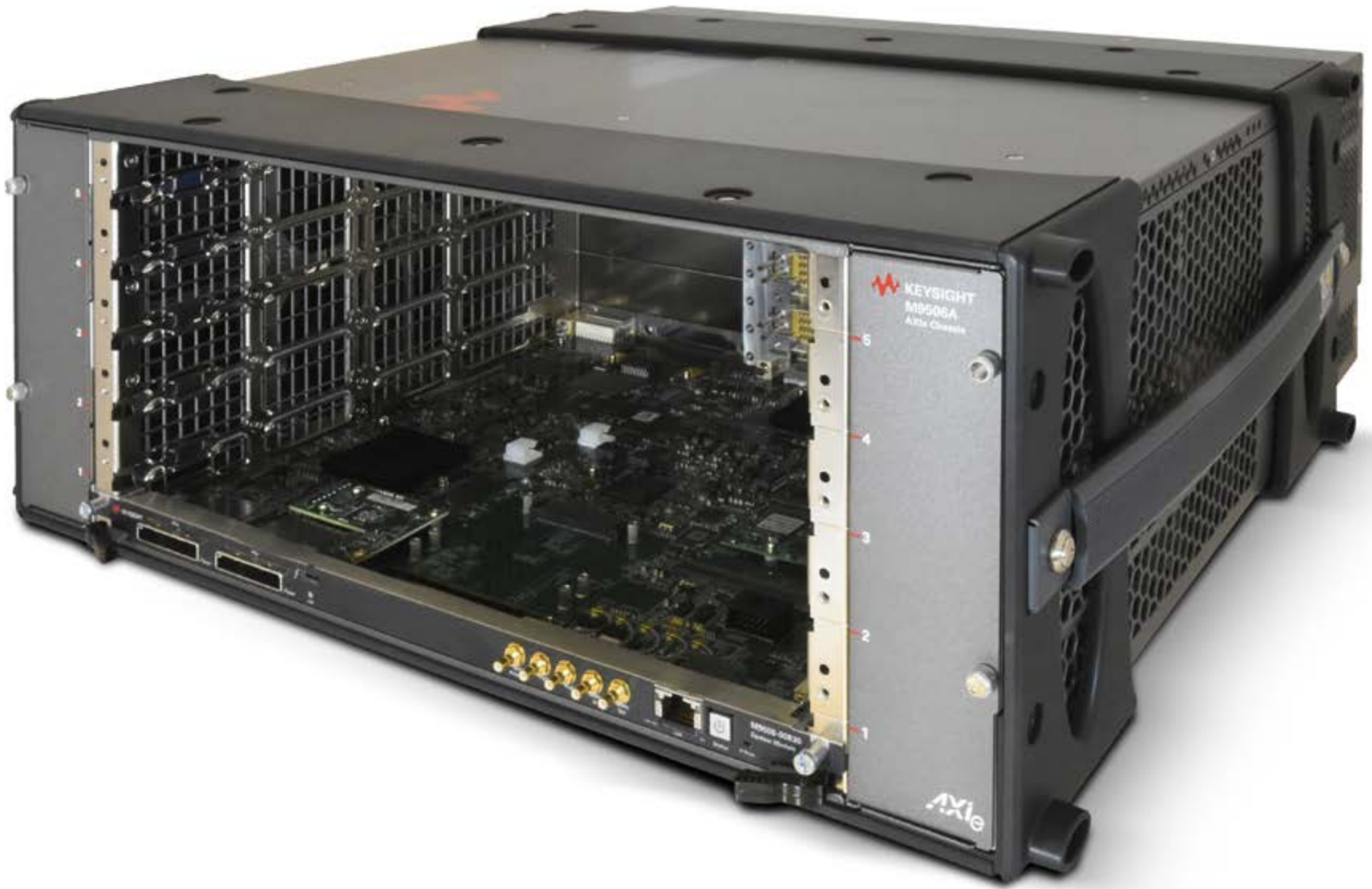
M9506A AXIe 插槽机箱