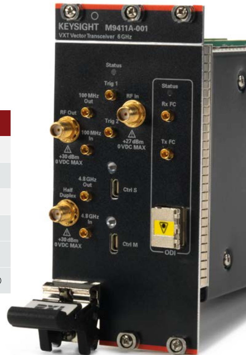
VXT PXI 矢量收发信机