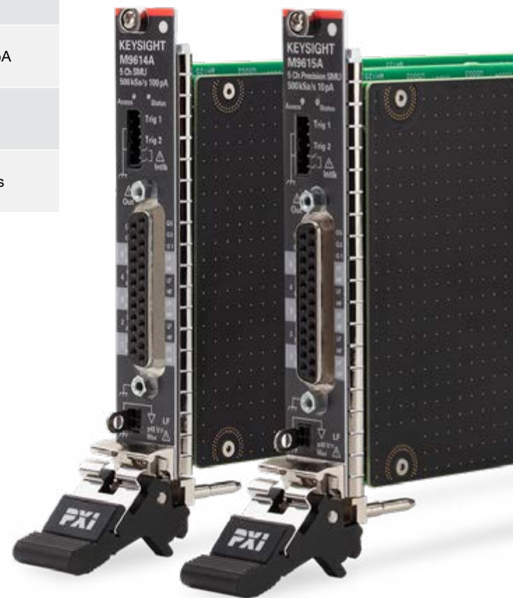
PXIe 5 通道源表模块