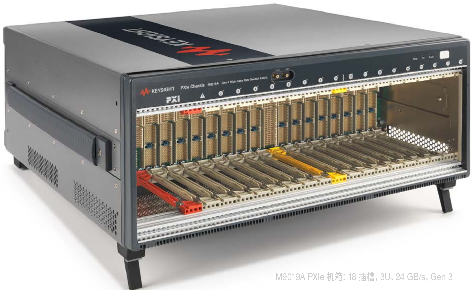
M9019A PXIe 机箱: 18 插槽, 3U, 24 GB/s, Gen 3